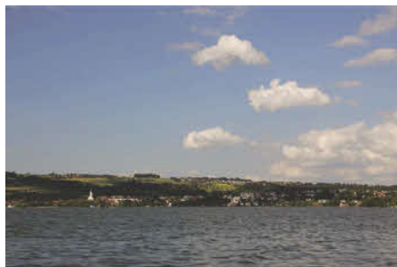
Un paysage idyllique trompeur: le lac de Sempach doit être oxygéné artificiellement depuis les années 1980.

Environ 50 % de la pollution des eaux en Europe est due aux élevages intensifs d'animaux. Les nitrates issus de l'agriculture ont pénétré si profondément dans le sol que certaines marques d'eaux minérales ne répondent plus aux normes de qualité exigées pour l'eau potable. 30 Aux Etats-Unis la part de la pollution des eaux due à l'agriculture est plus importante que celle due à toutes les villes et industries réunies. 31