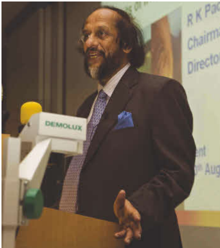
Rajendra Pachauri, président du Conseil sur le climat de l'ONU: « Mangez moins de viande – sa production entraîne de très importantes émissions de CO 2 . »

Les associations de protection de l'environnement recommandent souvent de consommer des produits régionaux et issus de l'agriculture biologique pour réduire les effets nocifs de notre alimentation sur le climat. Cependant, la consommation de produits biologiques ne représente pas à elle seule une solution pour résoudre le problème climatique. Des études réalisées par des scientifiques allemands ont montré que le fait de se